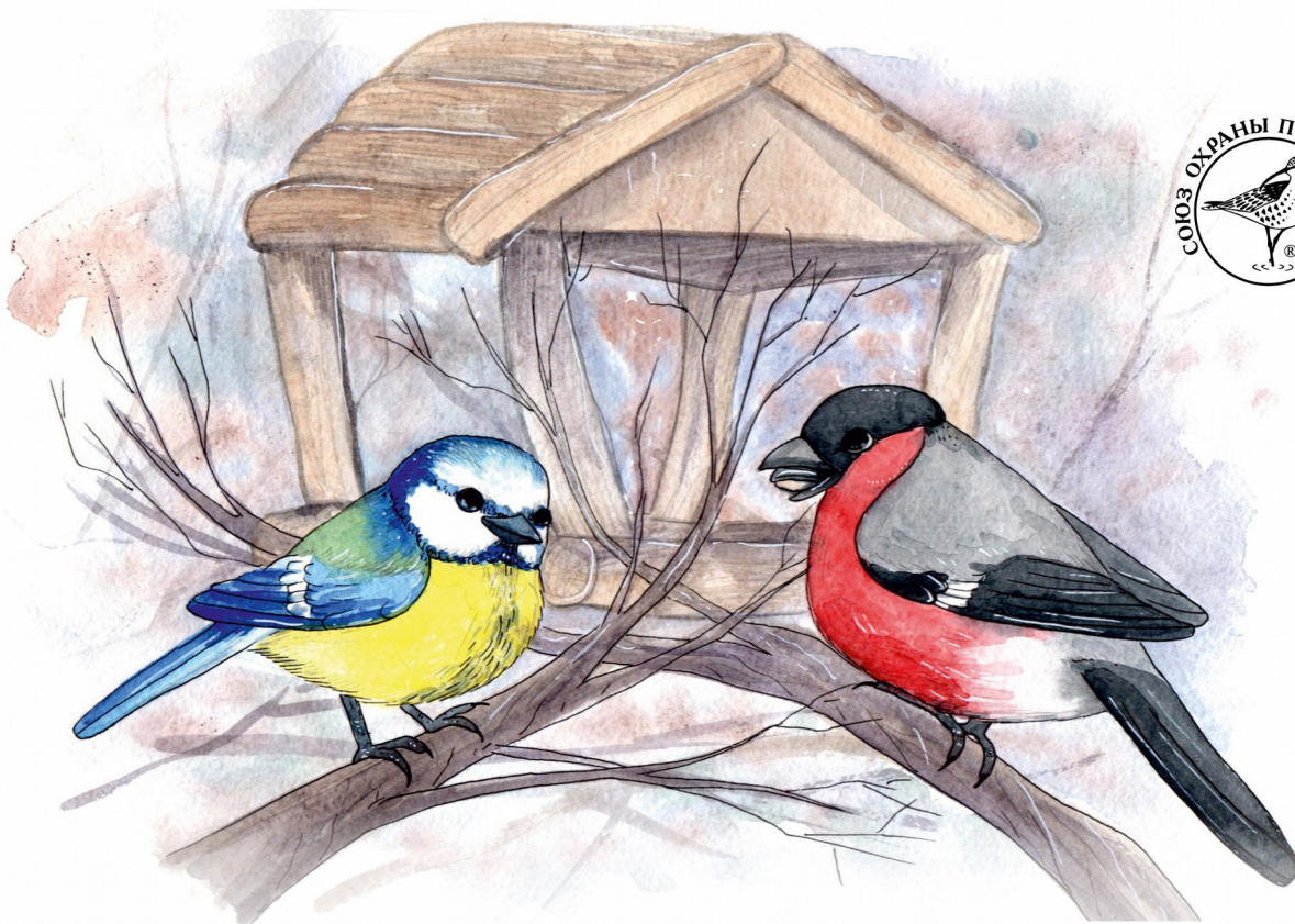
Иллюстрация: Анастасия Андрианова | Дизайн: Евгений Попов

КОУ Вичугская школа-интернат №2 рук-ль Бояркина И